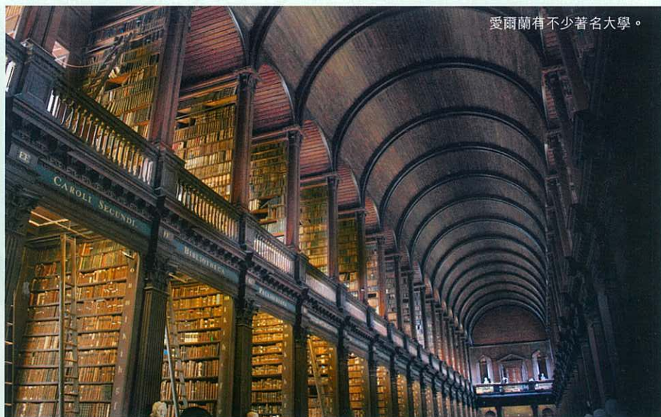
愛爾蘭有不少著名大學。

愛爾蘭設有7間理工學院，其中以都柏林理工學院規模最大，水準最高。在上世紀70年代，以地區性技術學院為主，到1988年，愛爾蘭政府將技術學院