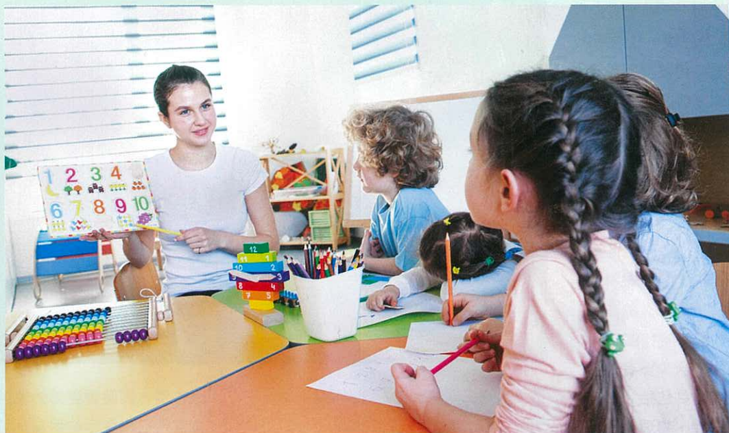
愛爾蘭民風純樸， 是近年不少人選擇 升學熱點之一。